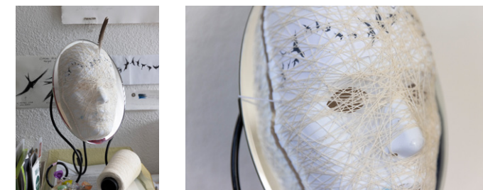
Objekt zum Thema Demenz

Senden Sie uns Ihren Leserbrief oder Ihre Kolumne! E-Mail: info@oaseservice.ch