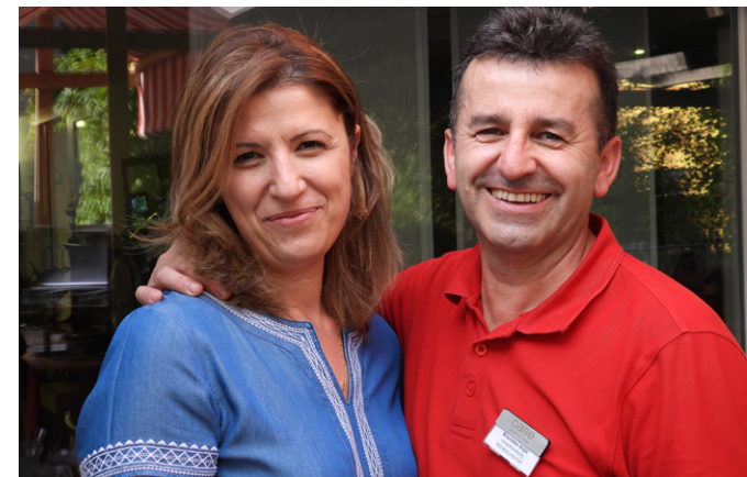
Serbischer Abend in der Oase am Rhein