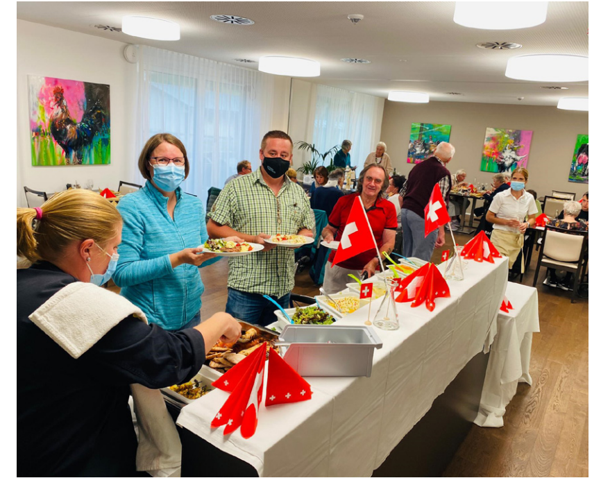
1-August-Feier in der Oase Churwalden