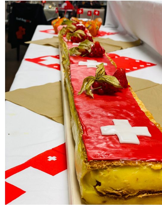
1-August-Feier in der Oase Churwalden