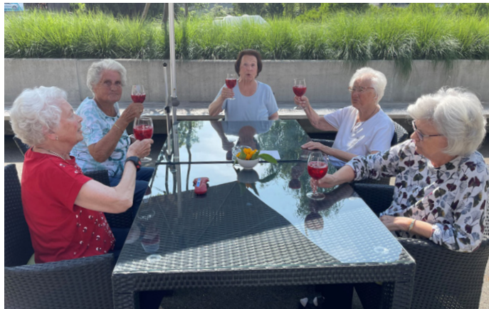
Sommerapero in der Oase Oetwil am See