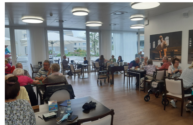
Spielnachmittag in der Oase Oberrösgen