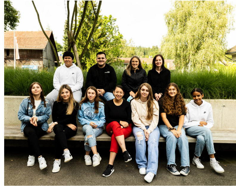
Die neuen Lernenden der Oase Gruppe